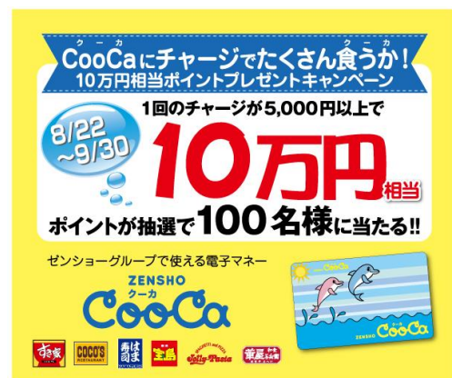
【キャンペーンバナー】